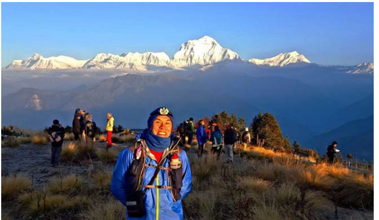
म्याग्दीको पर्यटकीय क्षेत्र पुनहिलमा रसाउँदै पर्यटक । मौसममा सुधार आएपछि पुनहिलमा घुम्न आउने पर्यटकको चाप बढेको छ ।