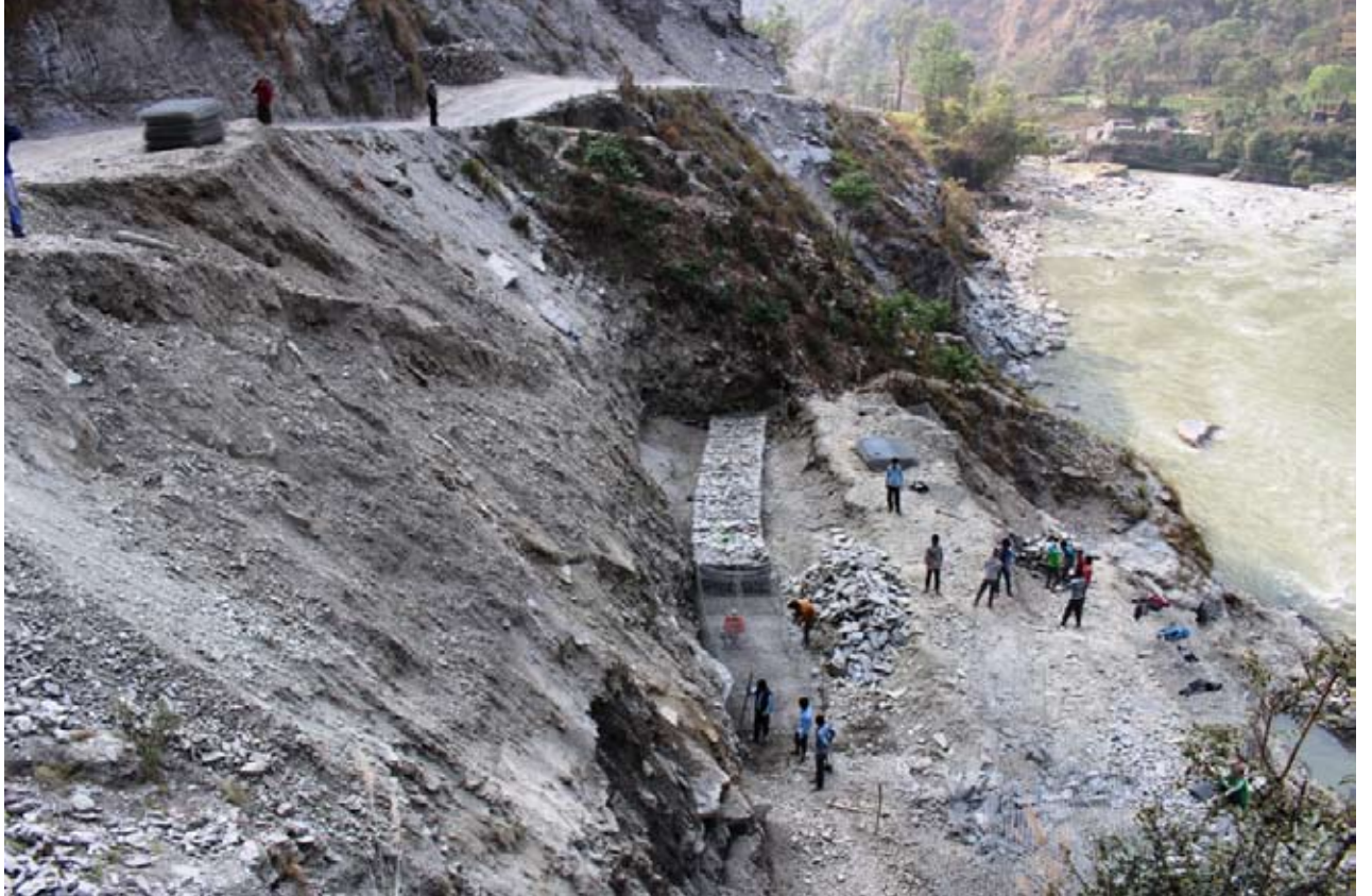
अव रोकिन्छ की पहिरो : बेनी दरवाडा सडक अन्तर्गत फाफरखेतमा पहिरो नियन्त्रण योजनामा काम गर्दै मजदुरहरू । वर्षातका समयमा यहाँ पहिरोले सडक अवरुद्ध हुँदै आएको थियो । तस्विर नवविकल्प