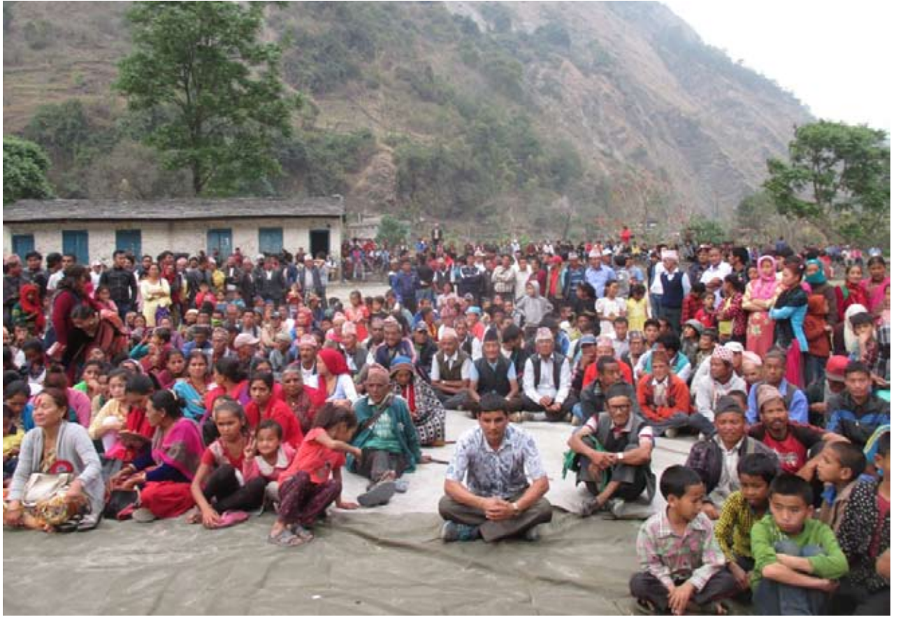
गाउँगाउँमा चुनावी सभा : स्थानीय तहको निर्वाचन नजिकिँदै जाँदा दलहरू चुनावी कार्यक्रम लिएर गाउँ पुग्न थालेका छन् । नेकपा एमाले म्याग्दीले दरवाडामा गरेको चुनावी सभामा सहभागीहरू स्थानीयहरू । तस्विर प्रताप बानियाँ / म्याग्दी