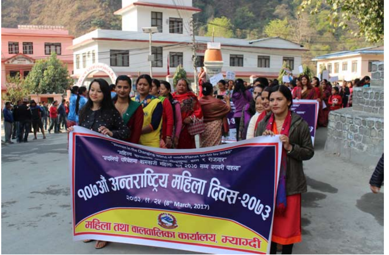
अन्तराष्ट्रिय महिला दिवस : ९०औँ अन्तराष्ट्रिय श्रमिक महिला दिवसको अवसरमा बुधबार बेनीमा निकालीएको न्यालीमा सहभागीहरू । म्याग्दीमा विभिन्न संघ संस्था तथा निकायले न्याली, अन्तरक्रिया कार्यक्रम आयोजना गरेर महिला दिवस मनाएका छन् ।