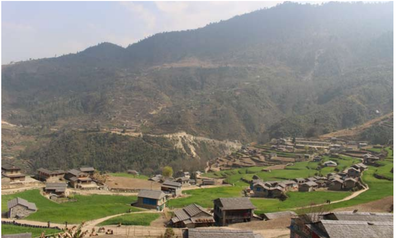
रुम गाउँ : यसैवर्ष सडक सञ्जालसंग जोडिएको म्याग्दीको रुम गाउँ । सडक पुगेपनि यातायात सुविधा नहुँदा रुमका बासिन्दा निराश भएका छन् ।