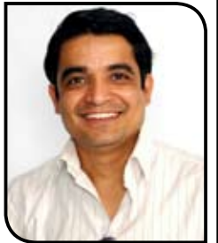
- कृष्ण जि.सी.

... म्याग्दी खोला छिट्टै नै सुक्नेवाला छ भने कालिगण्डकी पुल तरिहरन सायद नपर्ला । रहुंगा जस्ता सहायक खोला तथा खहरेहरू हिँउदमा नाम निशान सठम रहने छैनन् । यस्तो लेखिरहदा धेरै जनताले अचम्म मान्ने अवस्था आउनसक्छ तर यो सत्य हो त्यो समय धेरै टाढा छैन यदि यस्तै गतिमा वातावरणको प्रतिकूल असर देखिदै जाने हो भने २० ३० बर्ष पछि त्यो अवस्था आउँछ । धौलागिरी अन्नपूर्ण हिमाल काला पहाड मात्रै रहने छन् गुर्जा हिमाल मानापाथी र माछापुच्छे हिमालहरू त अहिले पनि काला पहाड भइसकेका छन् ।