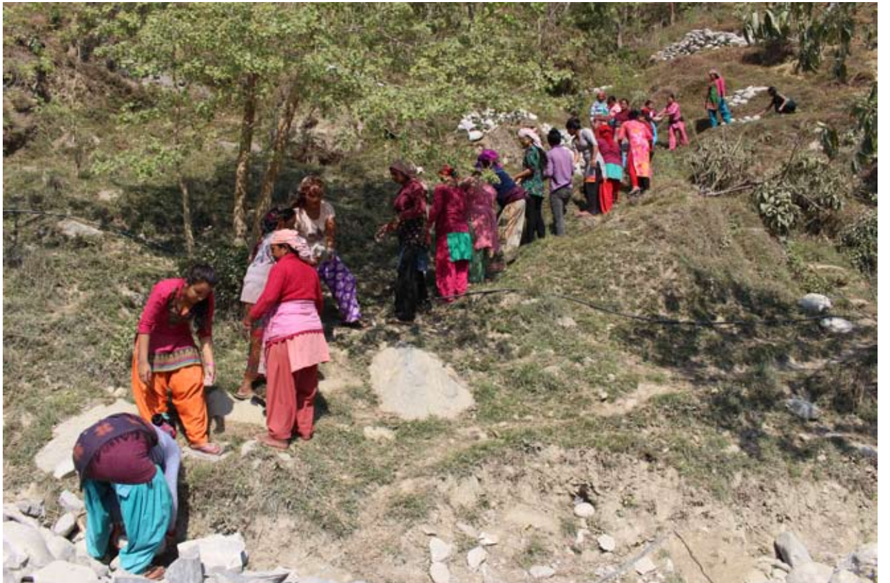
विकासमा अग्रसर : बेनी नगरपालिका ५ डम्मरामा अन्तराष्ट्रिय श्रमिक महिला दिवसको दिन सामुदायिक भवन निर्माणका लागि श्रमदान गर्दै स्थानीय महिलाहरू । डम्मरामा महिलाहरू विकास निर्माणमा अग्रसर छन् ।