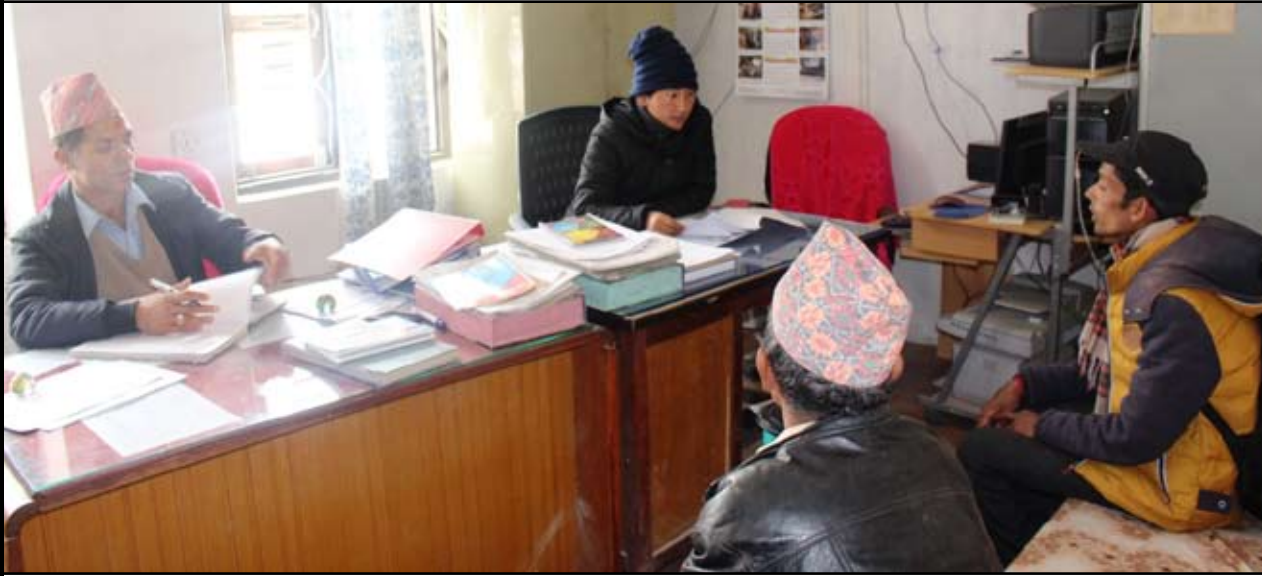
जिविसमा योजना सम्झौता गर्दै कर्मचारी र उपभोक्ता समिति । तस्वीर नवविकल्प