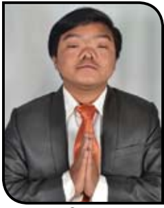
दर्पण रोका मगर