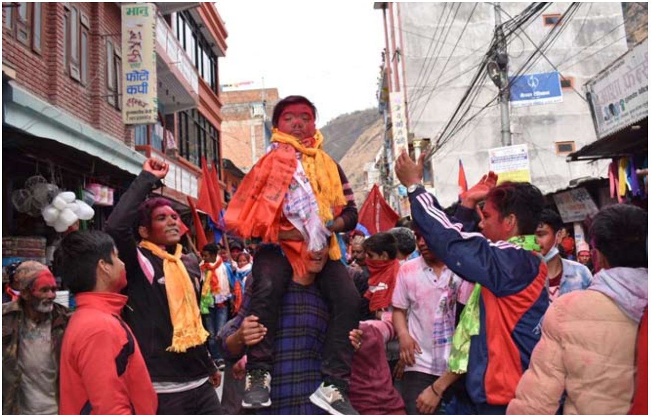
जीतको उत्साह : फागुन १८ गते सम्पन्न स्वविद्यु निर्वाचनमा अनेरास्ववियुको घ्यानलै विजयी भएपछि बेनीबजारमा खसियाली मनाउँदै विद्यार्थीहरू ।