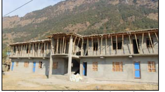
किसानी मावि बिमको निर्माणाधिन भवन ।

म्याग्दीमा सञ्चालित विद्यालय भवन निर्माण योजनाहरू अधुरा बनेका छ । देशभर समान लागत र मापदण्डमा एकै किसिमको भवन निर्माण गर्ने शिक्षा मन्त्रालयको अव्यवहारिक नीतिका कारण आर्थिक स्रोत जुटाउन नसक्दा कक्षा कोठा भवन निर्माण योजनामा ढिलाई भएको हो । भवन निर्माण कार्यले पूर्णता नपाउँदा जिल्लाका करिब एक सय विद्यालयको पठनपाठन प्रभावित भएको छ । भौगोलिक रूपमा विकट र दुर्गम क्षेत्रका विद्यालयका लागि कक्षा कोठा भवन योजना आर्थिक, प्राविधिक र नीतिगत समस्याका कारण गलपसो बनेका छन् ।