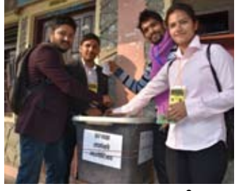
तस्वीरमा स्ववियु निर्वाचन (साताका तस्वीरहरु)