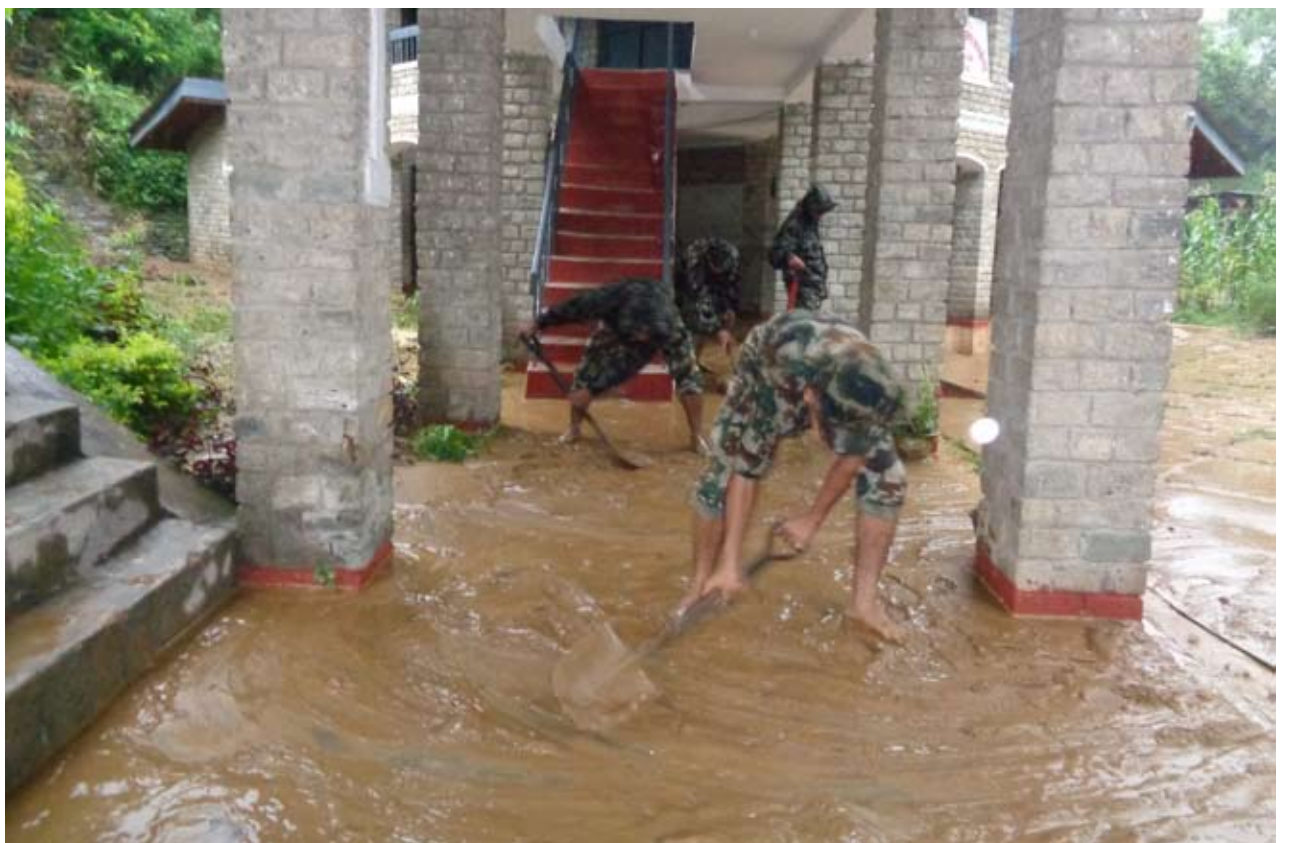
कार्यालयमा बाढी : वेनीको जिल्ला भुसंरक्षण, वन र पशु सेवा कार्यालयमा पसेको बाढी पन्ध्राउदै नेपाली सेना । पछाडीको पाखोबाट आएको बाढीले भुसंरक्षण, वन, पशु सेवा र सिचाई विकास कार्यालयमा क्षती गरेको छ ।