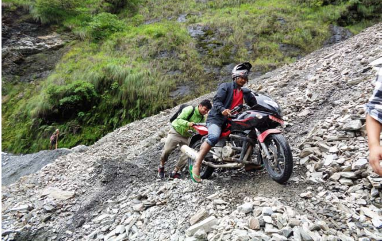
पहिरोमा मोटरसाईकल : वेनी-दरवाड सडकको फापरखेतमा खसेको पहिरोमा मोटरसाईकल ताँदै ।