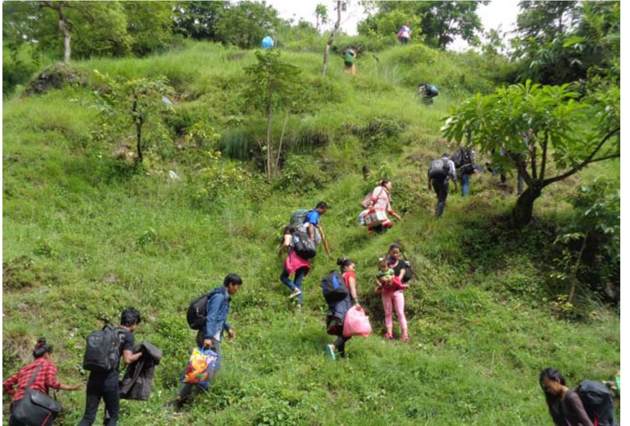
हिडनुपर्ने बाध्यता : वेनी-जोमसोम सडकको चमेरे खण्डमा पहिरोले सडक बगाएपछि हिडेर गलतब्यतर्फ जाँदै गरेका सर्वसाधारणहरू ।