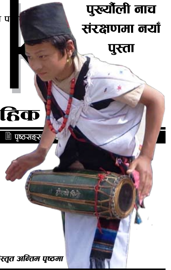
- विस्तृत अन्तिम पृष्ठमा

वर्ष ८ अङ्क ४५ पूर्णङ्क ३८३ आइतवार, श्रावण १६, २०७३ July 31, 2016, Sunday पृष्ठसङ्ख्या