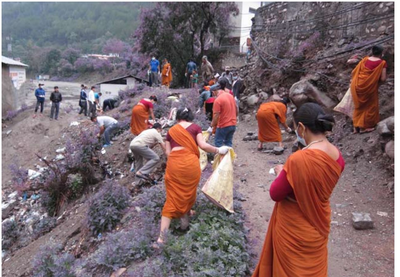
सरसफाई अभियान : वास पत्रकार मञ्च नेपाल, म्याग्दीको अगुवाईमा सुरु भएको कालीगण्डकी - म्याग्दी नदी सरसफाई अभियान पाँचौ हप्तामा सरसफाई गरिदै । पाँचौ हप्ताको सरसफाई अभियानको संयोजन म्याग्दी बौद्ध संघले गरेको थियो ।