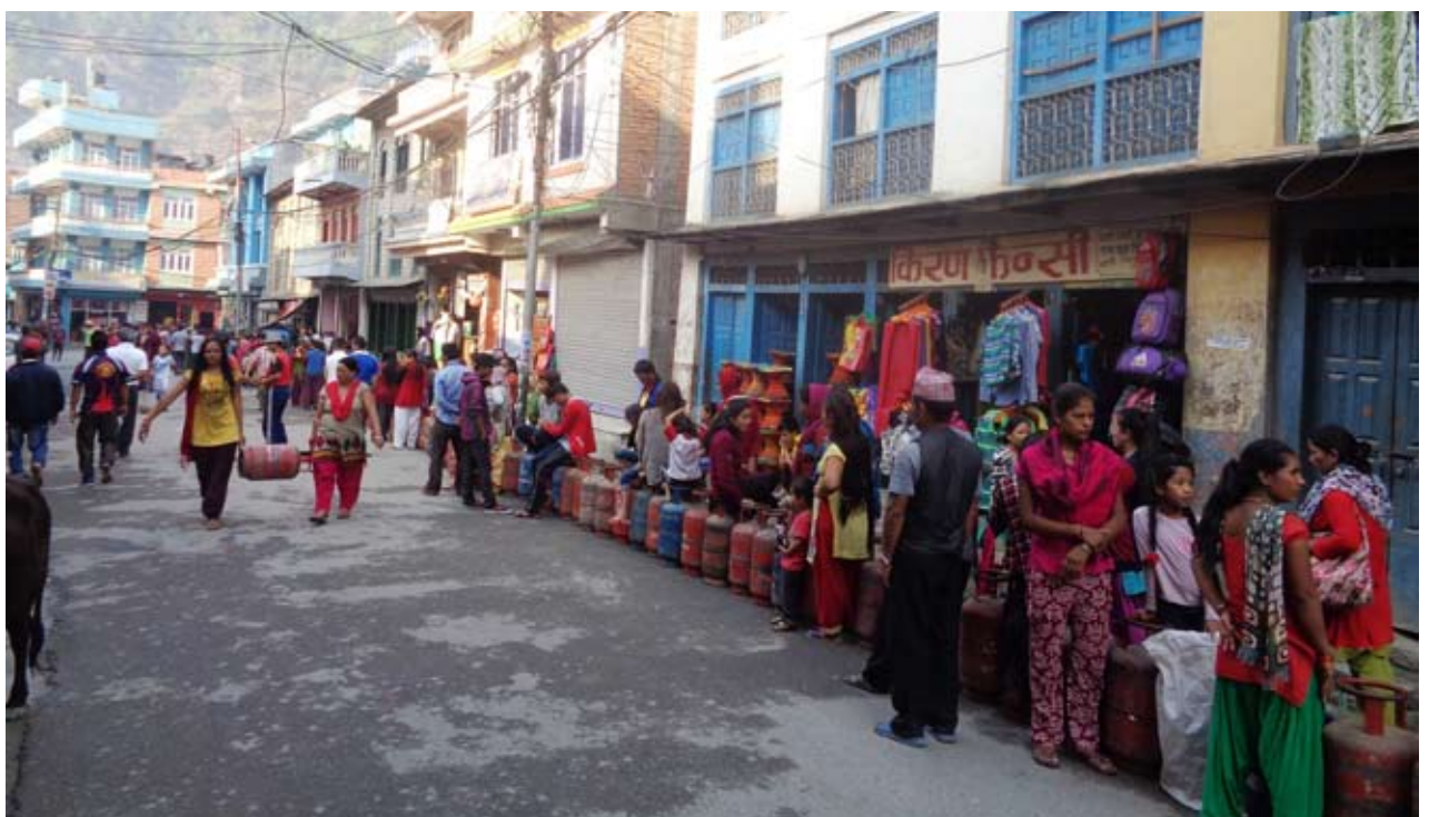
अभै हाहाकार : बजारमा खानापाकाउने ग्यासको अभै हाहाकार भएको छ । बजारमा प्रयाप्त मात्रामा ग्यास आए पनि उपभोक्ताहरूले सहजरूपमा पाउन सकेका छैनन् ।