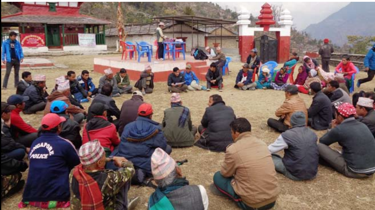
राखु भगवतीमा जिविस म्याग्दीले आयोजना गरेको इलाका स्तरीय गोष्ठीका सहभागीहरू । उक्त तस्वीरलाई परामर्शदाता कम्पनीले आवधिक योजना निर्माणका लागि इलाका स्तरमा गोष्ठी गरेको भन्दै प्रतिवेदनमा छापेको छ ।