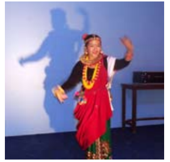
प्रतिभाशाली विद्यार्थीको खोजी - अन्तिम पृष्ठमा