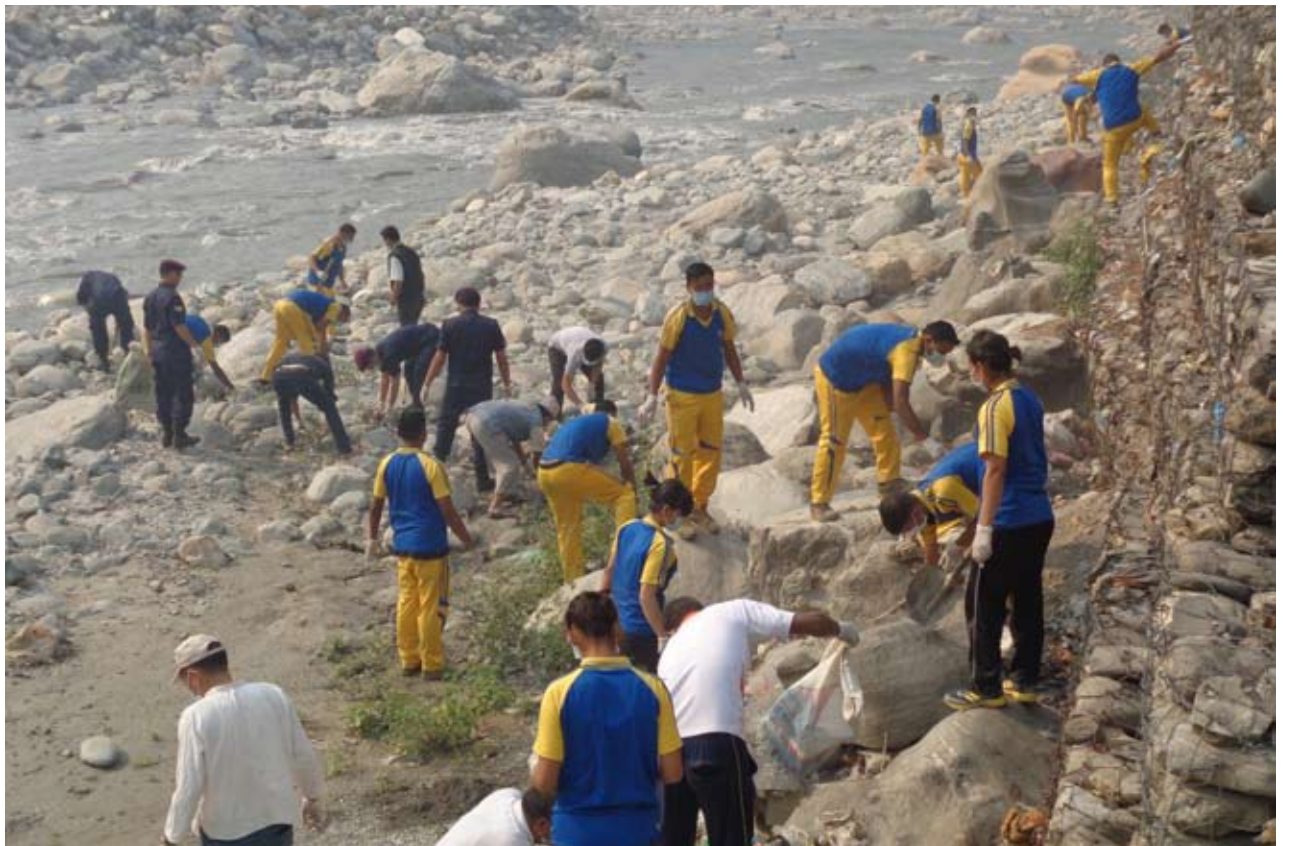
कालीगण्डकी सरसफाइ अभियानको दोस्रो हप्ता नदी किनार सफाइ गर्दै नेपाली सेना, नेपाल प्रहरी लगायत स्थानीयहरू ।