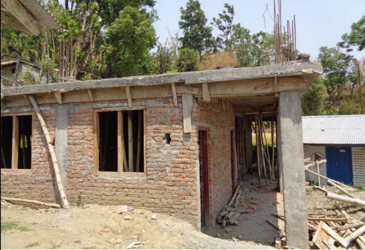
जनकल्याण माध्यमिक विद्यालयको निर्माणाधीन भवन ।