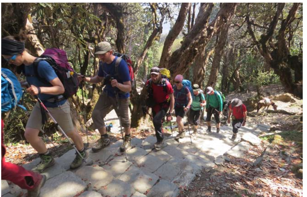
पर्यटक आगमनमा वृद्धि : घोडेपानी जाँदै गरेका पर्यटकहरू । भूकम्प र नाकाबन्दीका कारण थला परेको पर्यटन व्यवसाय विस्तारै पुरानै स्थितिमा फर्किएको छ ।