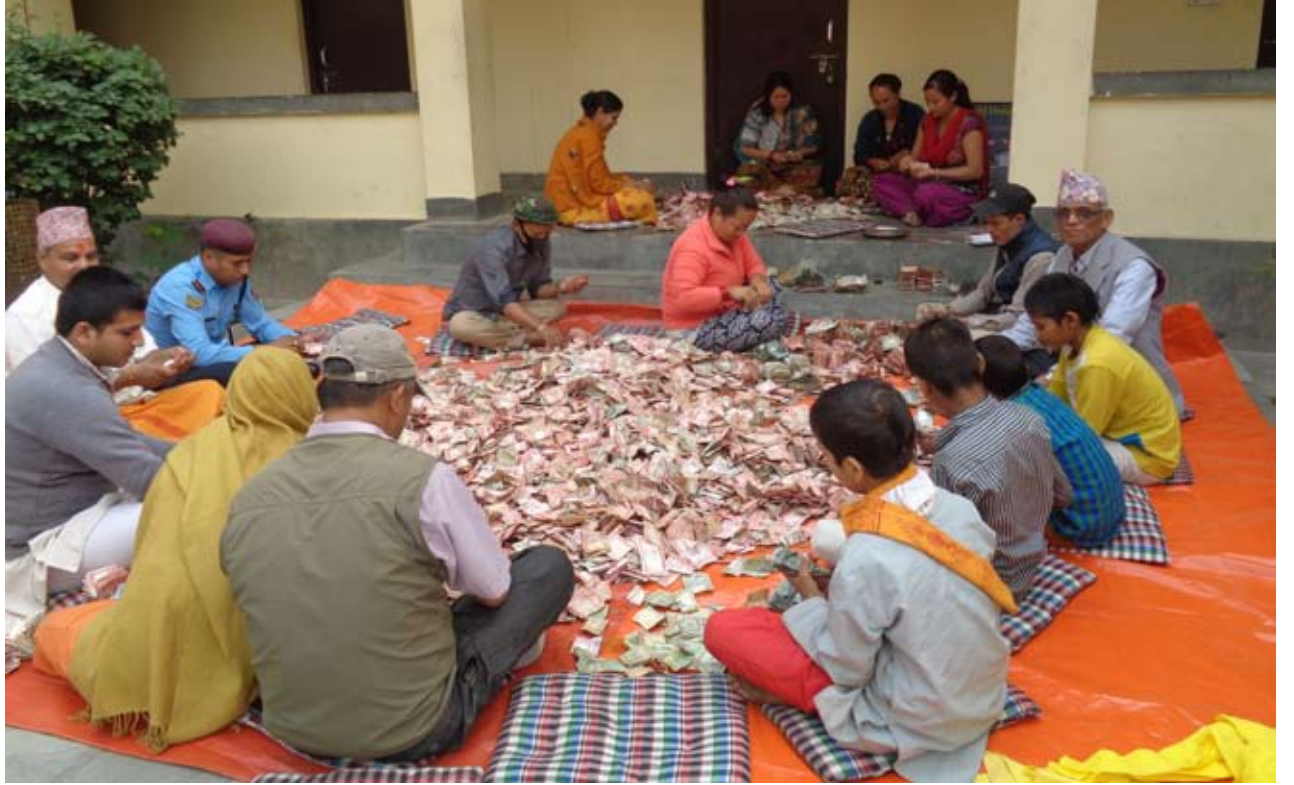
गलेश्वर शिवालय मन्दिरमा भक्तजनहरूले चढाएको भेटी गन्दै । चैत वैशाखमा अहिलेसम्मकै सबैभन्दा धेरै भेटी संकलन भएको गलेश्वर शिवालय क्षेत्र विकास कोषले जनाएको छ ।