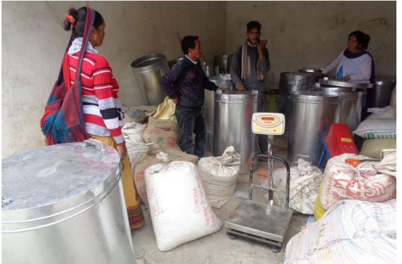
कृषकलाई औजार वितरण : जिल्ला कृषि विकास कार्यालयमा कृषकहरूलाई विउ राख्ने टिनको भाडो मेटलबिन वितरण गरिदै । कृषि विकास कार्यालयले कृषकलाई २५ प्रतिशत अनुदानमा ५० वटा मेटलबिन वितरण गरेको जनाएको छ ।