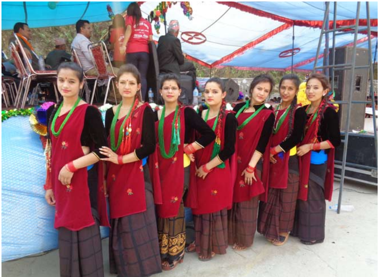
चौतण्डी चोलीमा घिटितकै : म्याग्दी बहुमुखी क्याम्पसको रजत जयन्तीको अवसरमा आयोजित समारोहमा परम्परागत पोशाकमा सजिएका छात्राहरू । म्याग्दी क्याम्पसले चैत २८ गते एक समारोहको आयोजना गरेर रजत जयन्ती मनाएको छ ।