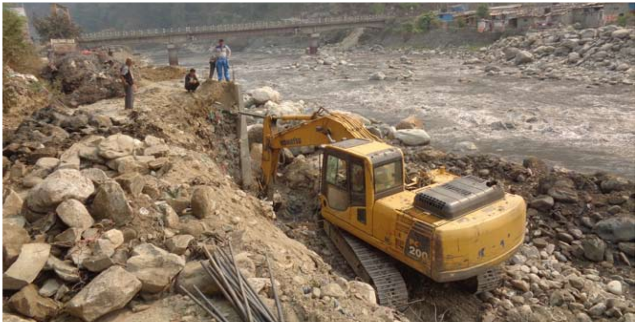
बदी नियन्त्रणको काम सुरु : म्याग्दी सदरमुकाम बेनी बजारलाई कालीगण्डकीको कटानबाट बचाउनका लागि पक्कि पर्खाल बनाउने तयारी गरिदै । विद्युत प्राधिकरणको कार्यालय मुनी देखि जेसीज भवन भन्दा माथिसम्म १२४.५ मिटर दुरीमा सात मिटर अग्लो आरसीसी पर्खाल लगाउने योजना रहेको छ ।