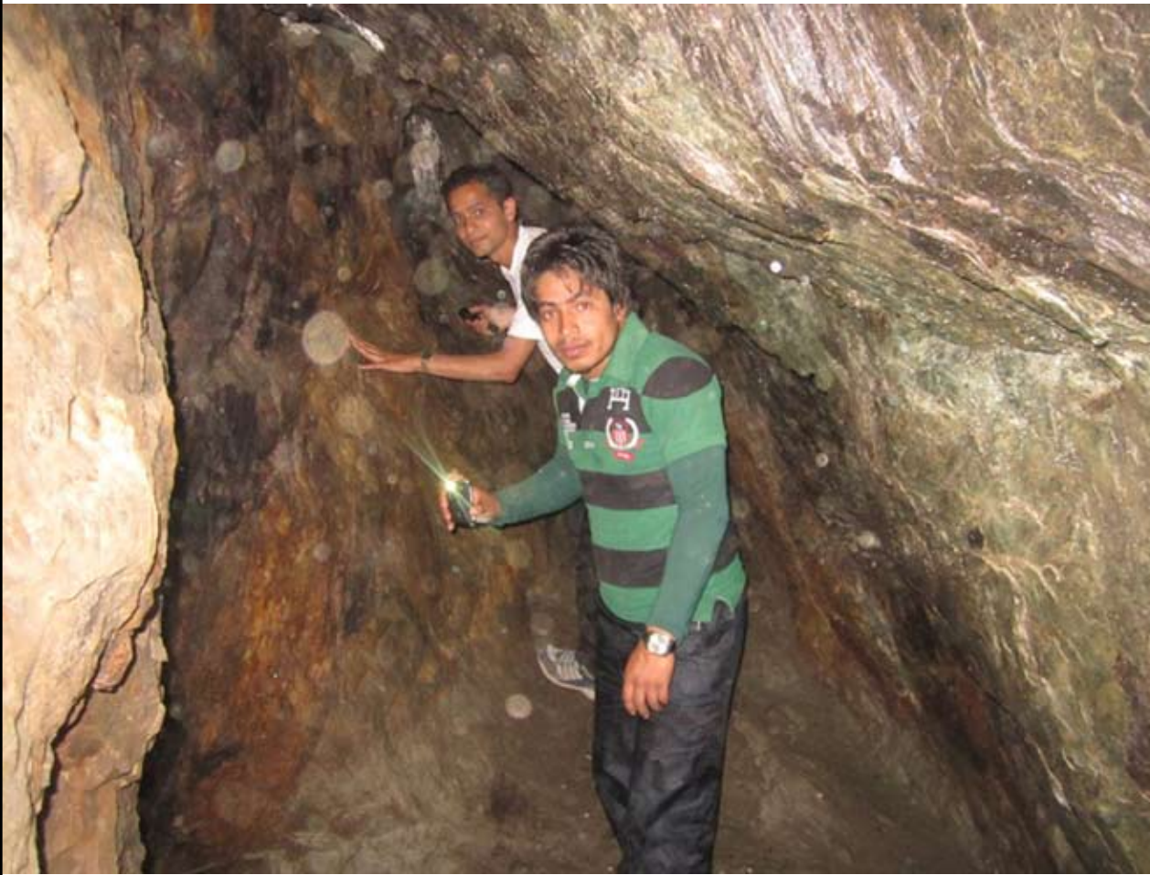
बन्द तामाखानी : म्याग्दीको मच्छिममा हाल बन्द अवस्थामा रहेको तामाखानी ।

म्याग्दीका विभिन्न ठाउँमा रहेका खानीहरू संरक्षण र उत्खननको पर्खाइमा रहेका छन् । तामा, स्लेट (घर छाउने ढुङ्गा) शिलाजीत, खरि, चुनढुङ्गाका खानीहरू वर्षौंदेखि बन्द अवस्थामा रहेका छन् । बन्द खानीहरूको संरक्षण