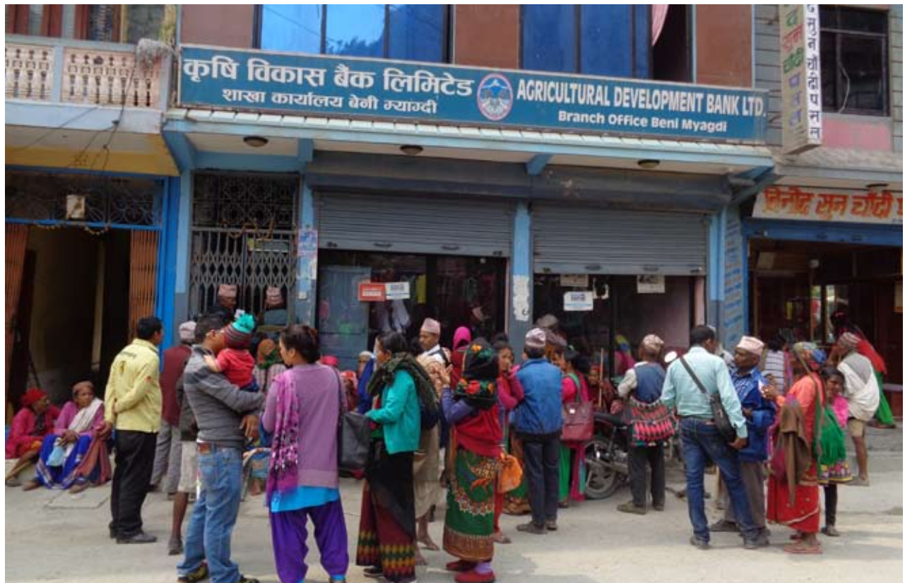
सुबिधा कि सास्ती: बेनी स्थित कृषि विकास बैंकको शाखा कार्यालयमा सामाजिक सुरक्षा भत्ता लिनका लागि नगरपालीकाको ग्रामिण क्षेत्रबाट आएका जेष्ठ नागरीकहरू । बैंकबाट सामाजिक सुरक्षा भत्ता वितरण गर्ने प्रक्रिया भञ्जटीलो र अव्यवस्थित हुँदा सेवाग्राहीलाई सास्ती भएको गुनासो गरेका छन् ।