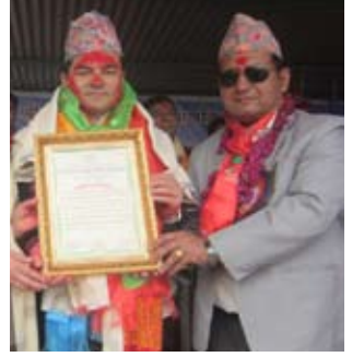
मनकारी परदेशी - विस्तृत पृष्ठ ३ मा