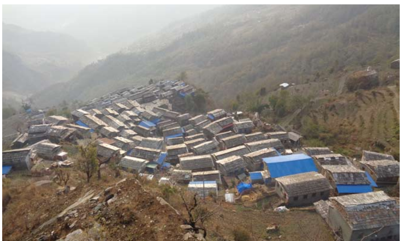
दोवा गाउँ: ढुङ्गाले छाएको घरहरूको गुजमुज्ज बस्ती रहेको मगर समुदायको बाहृल्य बसोबास रहेको उत्तरी म्याग्दीको दोवा गाउँ ।