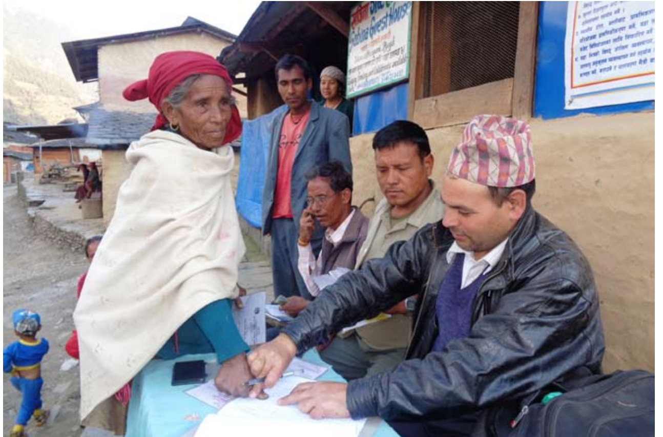
निरक्षर नागरिक : म्याग्दीको ताकम गाविस २ धारापानीकी निरक्षर महिला गाविस कार्यालयले वितरण गर्ने सामाजिक सुरक्षा भत्ता लिनेका लागि औठाछाप (ल्याप्चे) लगाएर भरपाई गर्दै । गाउँमा अझै पनि निरक्षरहरू छन् । साक्षर बनाउने भन्दै वर्षेनी आउने बजेट बालुवामा पानी जस्तै भएको छ ।