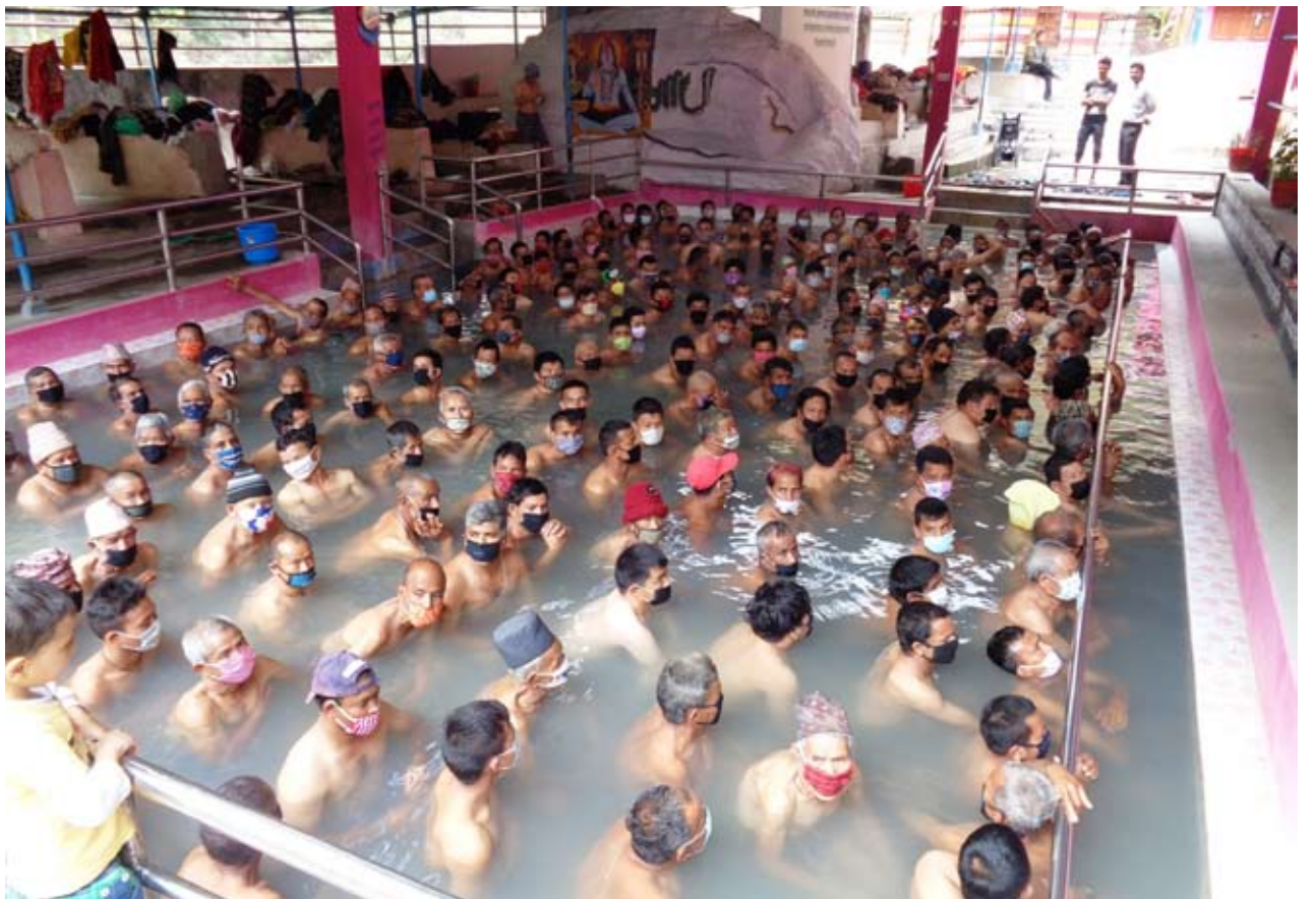
रोग निको हुने आशा : जिल्लाको सिंगा तातोपानी कुण्डमा रोग निको हुने आशामा तातोपानी कुण्डमा नुहाउनेहरूको संख्यामा वृद्धि भएको छ ।