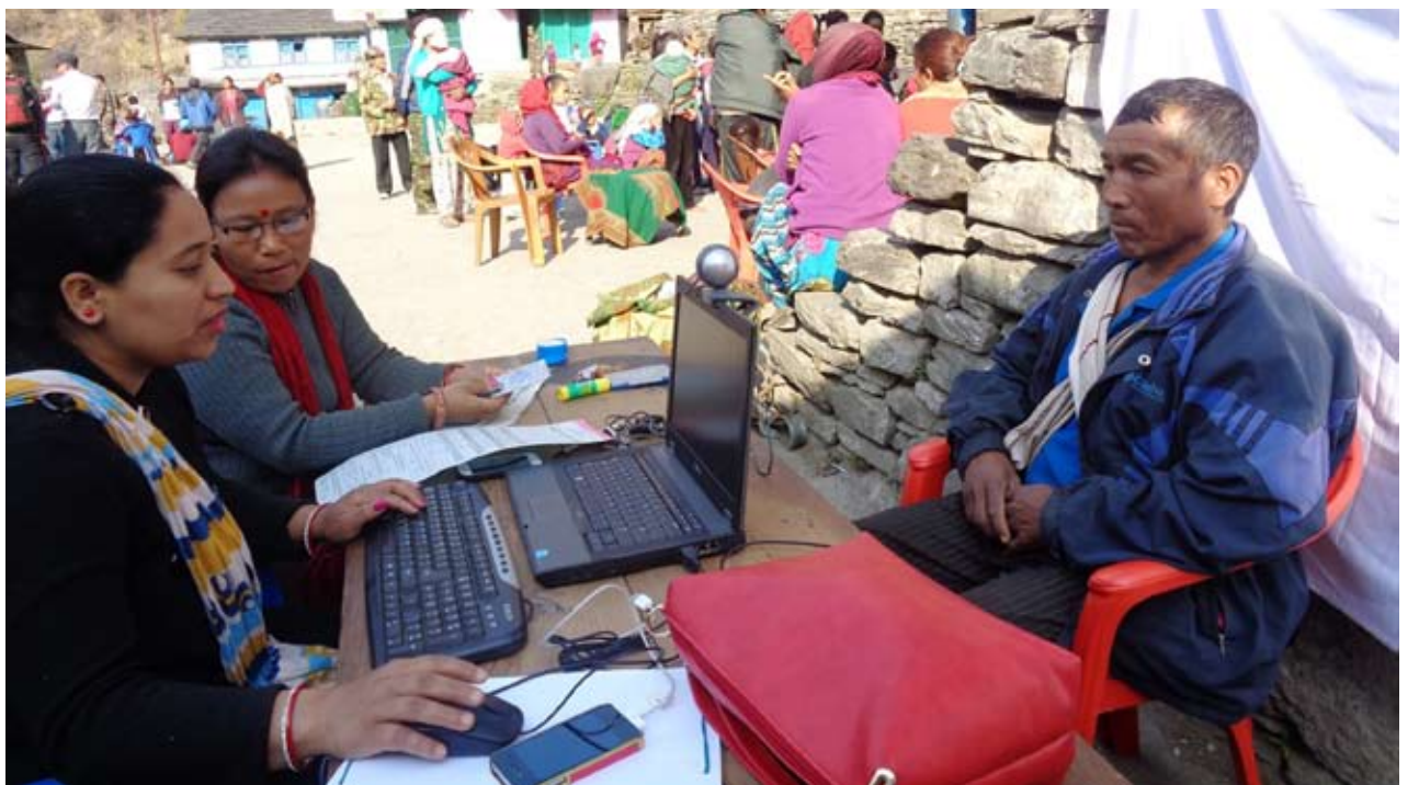
मतदाता अभियान : जिल्लाको चिमखोलामा फोटो सहितको मतदाता नामावली टोली सँग फोटो खिचाउँदै स्थानीय । निर्वाचनले कार्यालयले यतिखेर मतदाता संकलन अभियान सञ्चालन गरेको छ ।