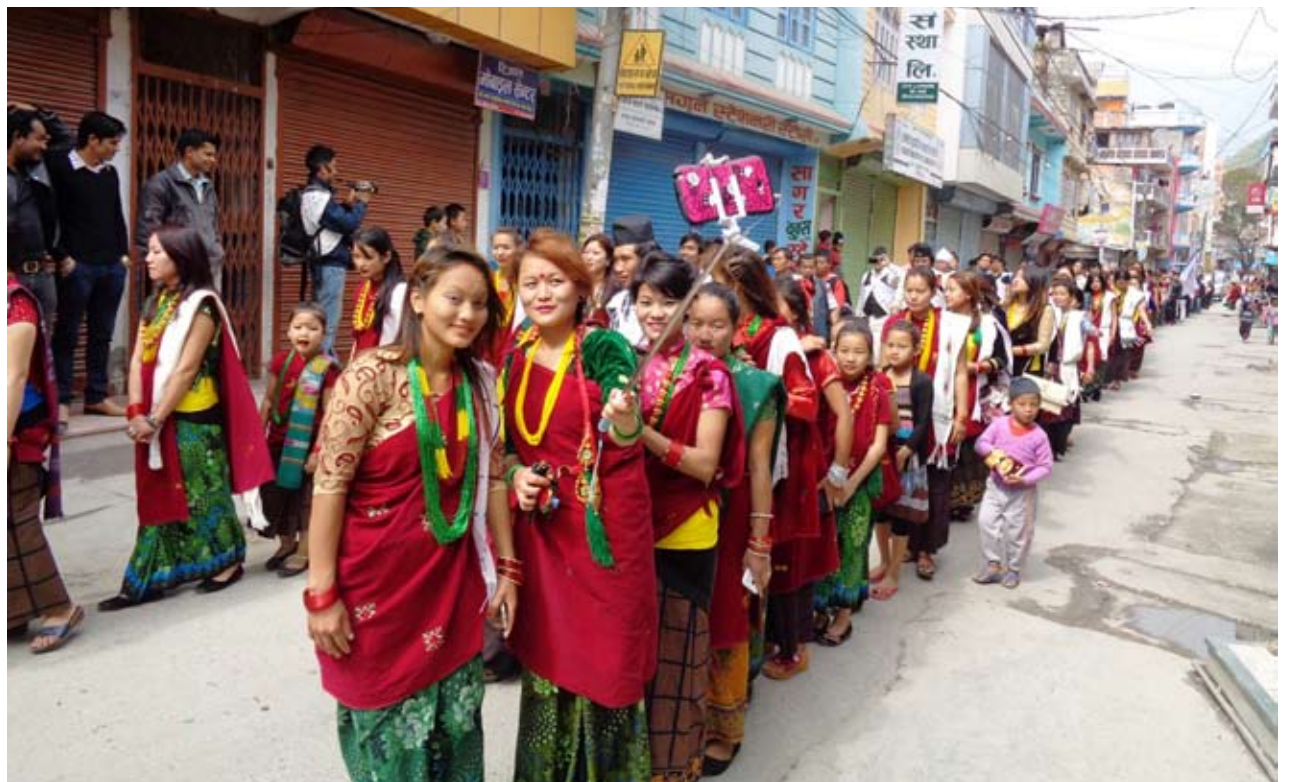
मगर भाँकी: ३४ औं मगर दिवस तथा नेपाल मगर संघ म्याग्दीको छैठौं जिल्ला अधिवेशनको अवसरमा बजारमा निकालिएको मगर समुदायको भाँकी सहितको न्यालीमा सेल्फी लिँदै मगर युवतीहरू ।