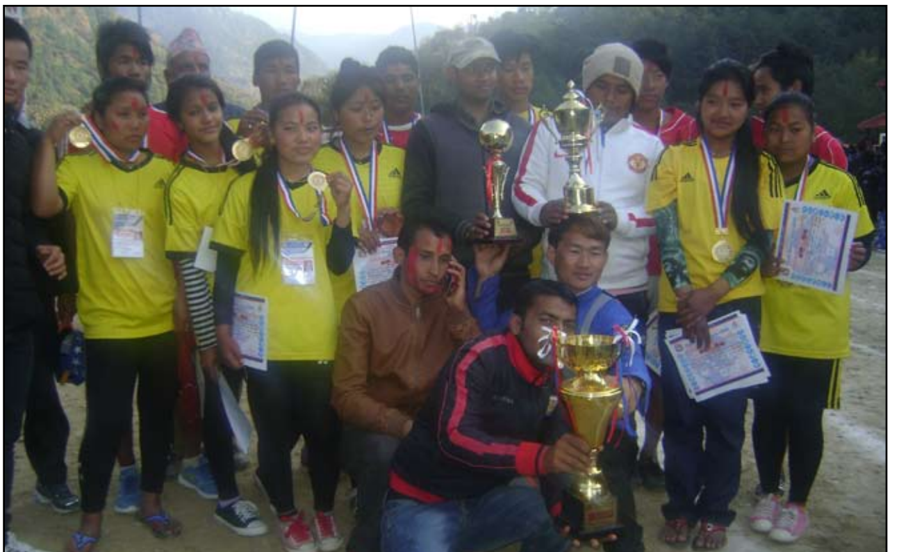
मलिबलमा अग्रणी : बेनीमा सञ्चालन भएको दोस्रो राष्ट्रपति रनिङ शिल्ड प्रतियोगिता-२०७२ को उपविजेता टुफीका साथमा महेन्द्ररत्न उच्च माध्यमिक विद्यालयका शिक्षक तथा विद्यार्थीहरू । बर्जाले यस पटक छात्र तथा छात्रा दुबै मलिबल खेलमा प्रथम भई दोस्रो राष्ट्रपति रनिङ शिल्ड प्रतियोगितामा समग्रमा द्वितीय भएको छ भने अधिल्लो संस्करणमा समेत द्वितीय भएको थियो ।