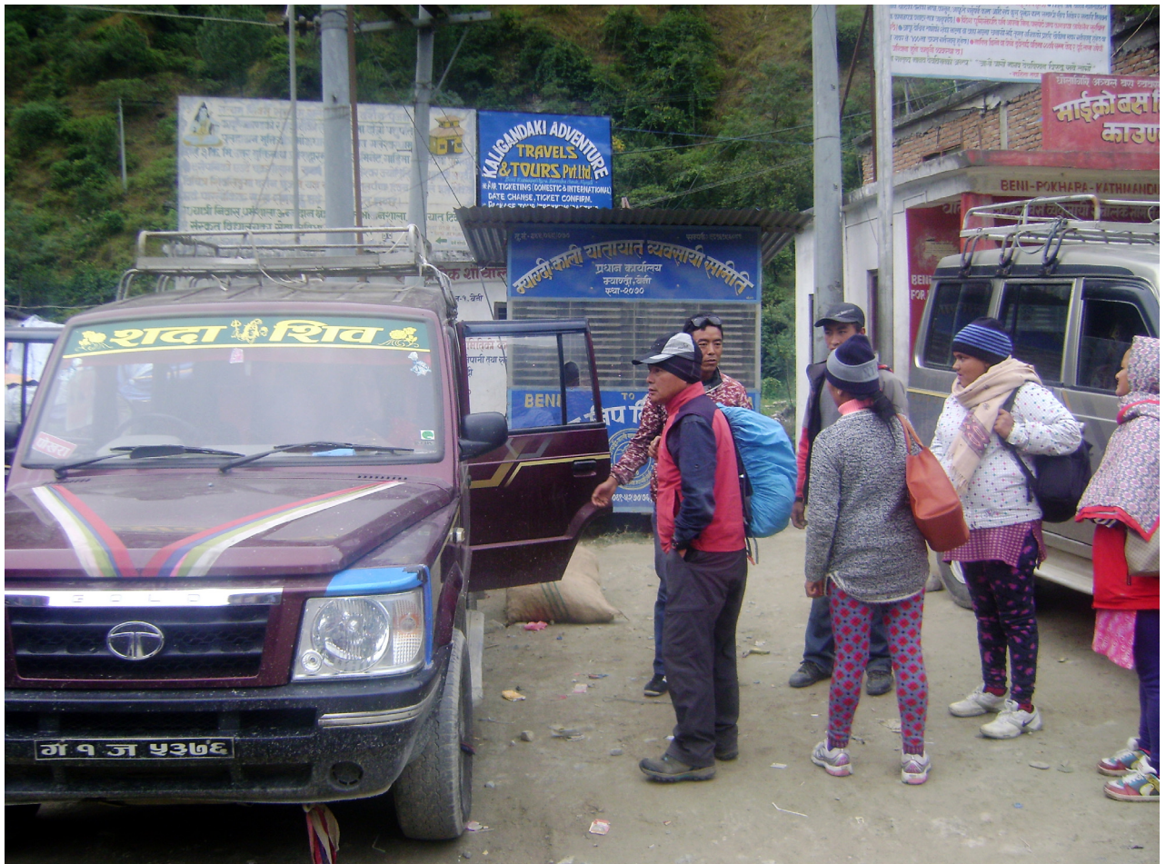
भाडा बागेनिड : कालीपुल बसपार्क बेनी म्याग्दीबाट पोखरातर्फ जाने यात्रुहरू भाडा बागेनिड गर्दै । पछिल्लो समय इन्धन अभावको कारण देखाउँदै ट्याक्सी, जीप तथा बस व्यवसायीहरूले मनपरी भाडा लिने गरेको गुनासो यात्रुहरूको छ ।