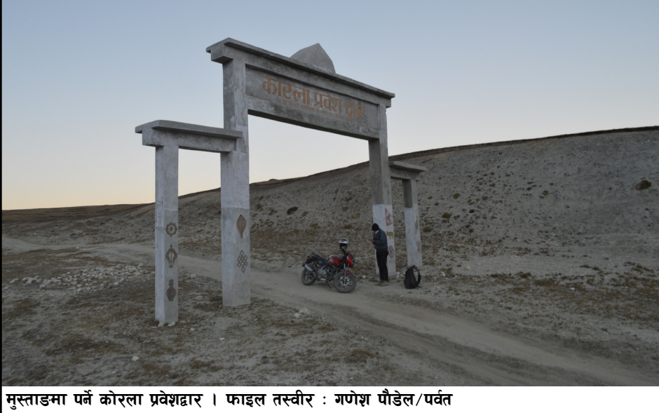
मुस्ताङमा पर्ने कोरला प्रवेशद्वार ।

भारतले गरेको अघोषित नाकाबन्दीका कारण देशभरको जनजीवन