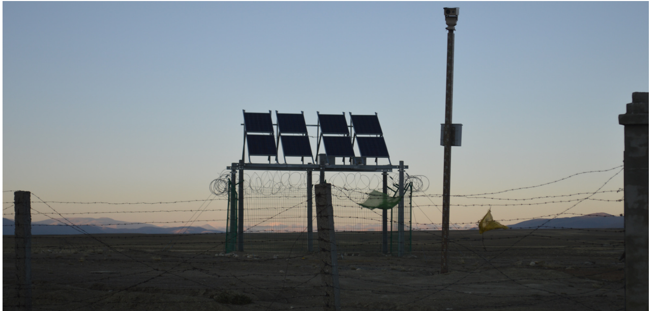
नेपाल र चीन बिचको कोरला नाकामा चीन सरकारद्वारा राखिएको सिसीटिभी लगायतका उपकरणहरू ।